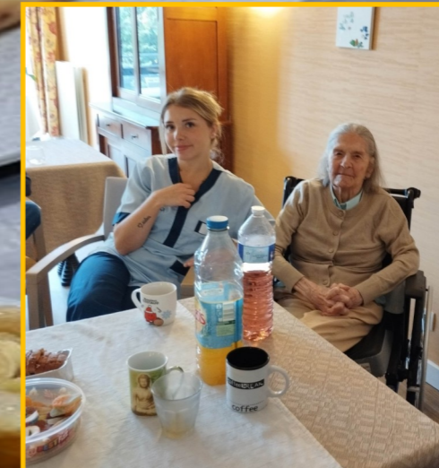
Deux bouteilles pour deux sourires !