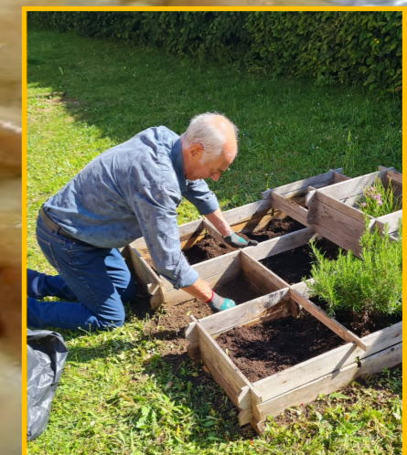
Les mains dans la terre !!