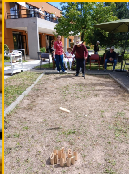
La jeune et l'ancienne génération