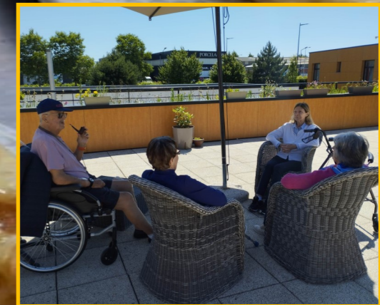
Une petite après midi à l'ombre