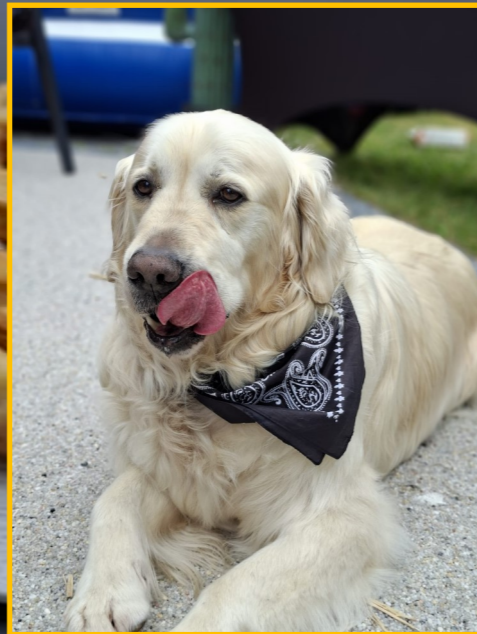
C'est à quelle heure le barbecue ?

« La vraie fête, c'est faire ce dont on a envie, indépendamment de ce que font les autres, sans tenir compte du calendrier, en se moquant des usages et en faisant fi du qu'en- dira-t-on. Rare et difficile. » Philippe Bouvard