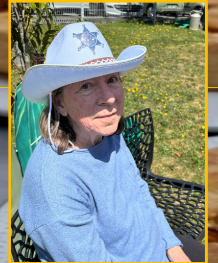
Une jolie cowgirl !